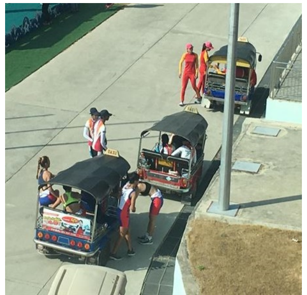
表彰ステージに向かう選手

表彰式がある日には表彰クルーは帰艇後すぐに表彰ステージに移動する必要がある。レースが終了すると POJ が入賞クルーを無線で連絡し、連絡を受けた主審はクルーに帰艇桟橋ではなく Umpire Boat Pontoon に向かうよう指示をする。Umpire Boat Pontoon では ITO が待機し、すぐに陸上で待機しているトゥクトゥク車に乗り、表彰ステージに向かう。この一連の動きをスムーズに進めるには関係各所との連携が大切だと感じた。