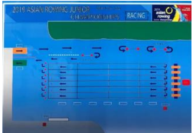
航行ルール（レース時）

ルール上は白ブイの左から出て練習水域、スタートに移動するが右図のように右側を漕ぐクルーが多かった。