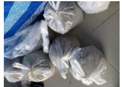
作ったデッドウェイト