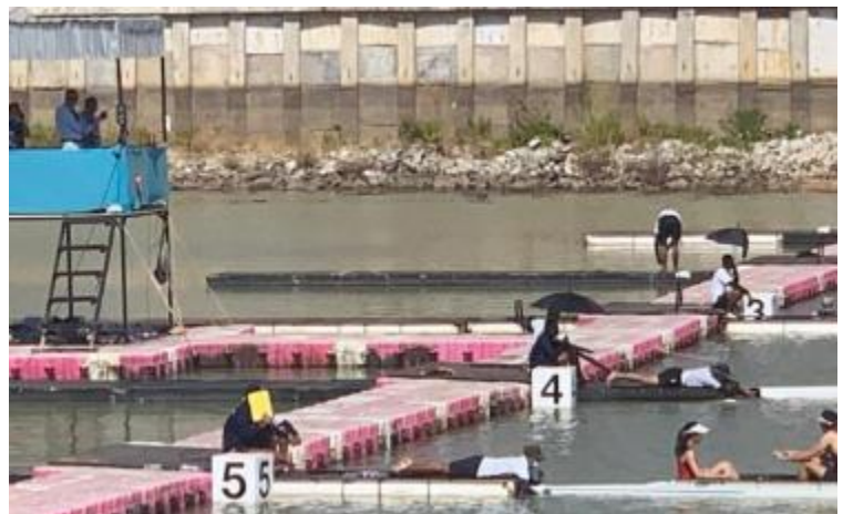
イエローカードを日よけにするボートホルダー

IMAS のスタートシステムを使用、ただし水深が足りなかったため、自動発艇装置は使用しなかった。