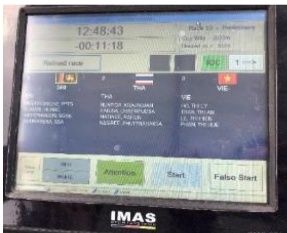
IMAS のスタートシステム