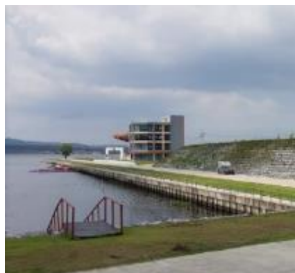
フィニッシュタワー