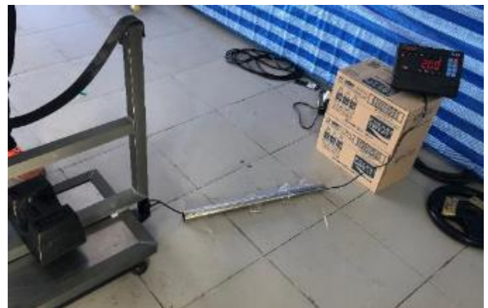
奥側 数値を合計する