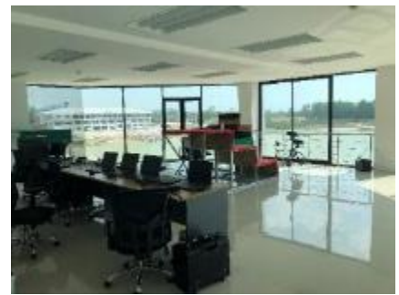
フィニッシュタワー内